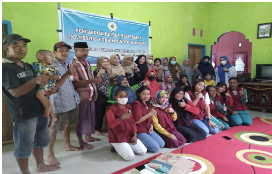
Gambar 1. Sosialisasi PHBS

Dengan adanya reformasi di bidang kesehatan ini maka paradigma pelayanan difokuskan pada upaya-upaya Promotif dan Preventif. Pada aspek kesehatan lingkungan, kesehatan lingkungan merupakan faktor penting dalam kehidupan sosial masyarakat, bahkan merupakan salah satu unsur penting dalam menentukan kesejahteraan penduduk. Dengan demikian, lingkungan yang bersih dan sehat bertujuan untuk mewujudkan mutu lingkungan hidup yang lebih sehat dengan pengembangan sistem kesehatan kewilayahan untuk menggerakkan pembangunan lintas sektor berwawasan kesehatan. Ada beberapa faktor yang menyebabkan masyarakat kurangnya pemahaman terhadap kesehatan lingkungan. Selain itu juga rendahnya kualitas pendudukan yang ada pada masyarakat sehingga menimbulkan permasalahan sosial di masyarakat [9].